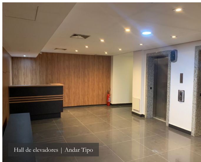
Hall de elevadores | Andar Tipo